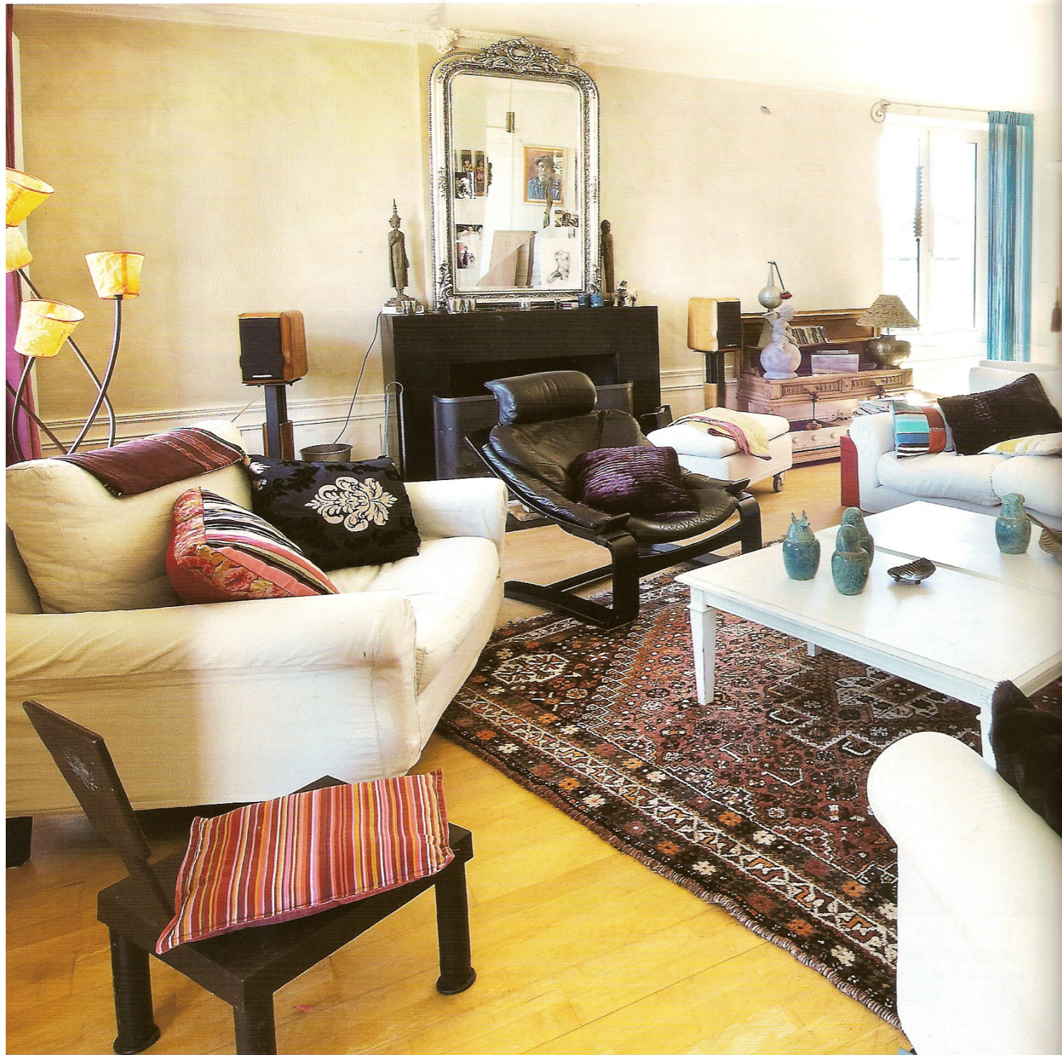
Ci-dessous fauteuil Rochebobois.

Au vu de la belle hauteur sous plafond (plus de sept mètres), l'atout d'un étage au-dessus du séjour s'est naturellement imposé. L'escalier blanc, accolé à une poutre maitresse qui a été sauvegardée, mène à une vaste mezzanine abritant les chambres des deux filles et la suite parentale. A l'étage aussi, la chaux est omniprésente, alliant jeux de couleurs (salle de bain ci contre d'une des filles, contraste de rouge et de vert) ou élégante sobriété (jaune pâle de la chambres des parents, photo en bas à droite).